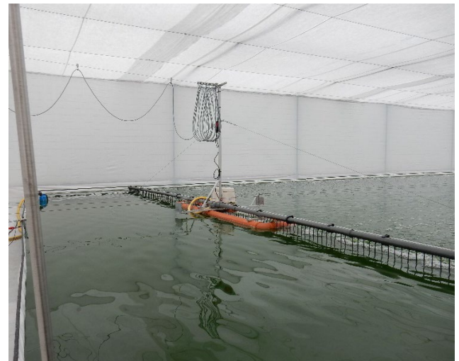
Abbildung 3: Im Gewächshaus installiertes H-System der NOVAgreen (Open-Pond-System) mit Belüftungskamm

Als Hauptregel gilt: Je besser die Lichtverfügbarkeit ist, desto höher ist die Stoffwechselaktivität und damit auch der Biomasseaufbau. Der benötigte Energieinput zur Kultivierung hängt von der Art des Reaktors und von den verwendeten Algen ab. Für die Produktion lässt sich der Energieverbrauch in folgenden Bereichen erfassen (Dillschneider 2014):